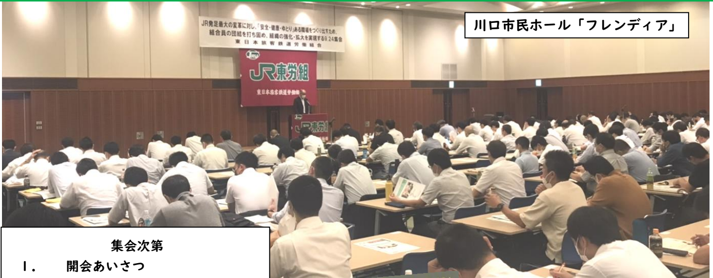
川口市民ホール「フレンジア」