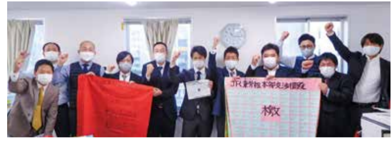
宇都宮支部のみなさん

本場に悔しく、厳しい結果ではあります。21春闘で勝ち取れなかった課題解決のため、今回の妥結結果について職場で議論を深めて下さい。その意見を踏まえ、今後のたたかいを創造していきます。 今春闘においても、JR東労組が団体交渉で職場の苦勞や奮闘、変革2027に引き合っていることなど訴えたことも加味されて「昇給係数2」の判断に至ったと会社は回答しています。