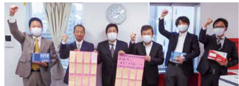
上野新幹線第二運転所分会 (当時) のみなさん

やってきたのに、モチベーションが上がらない」「生涯賃金にかかわるし、ローンの支払いとか心配」「団体交渉で定期昇給の実施を求めていなければゼロだったのではないかな」と、申し入れて議論したからゼロにはならなかった。労働組合は必要だ」などの声がすでに寄せられています。