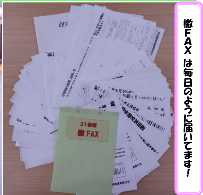
檄FAXは毎日のように届いています！

組合員の声に踏まえた賃金引上げ等の要求の実現に向けて、 建設的な議論を行っていきます！