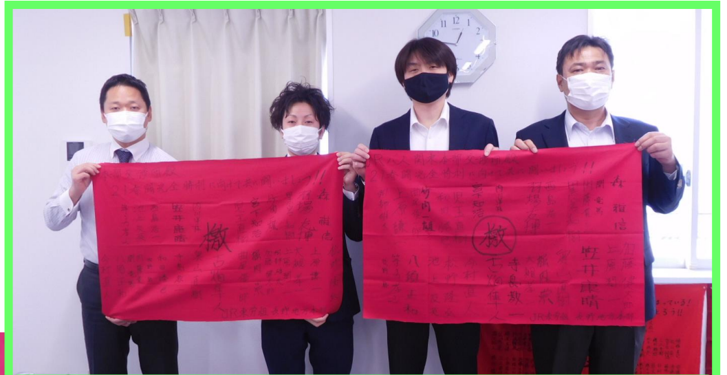
長野地本の仲間からの檄を青年部長が届けてくれました！