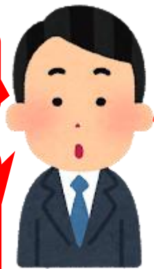
八王子地本 執行委員

私たち東京、水戸、八王子、バスの仲間はいつまでも形式にこだわり、組合員の利益を守る指導部とは言いがたい。 中央本部に見切りをつけ、 悩み苦しんでいる仲間に寄り添い、連帯の輪を広げ、健全な企業の発展のために実践していくことを宣言する