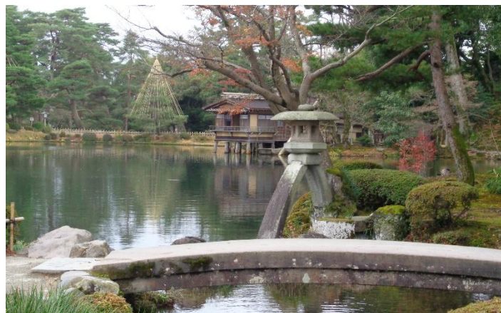
兼六園の美しい庭に感動