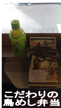
こだわりの 鳥めし弁当