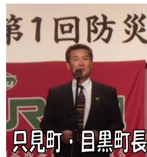
只見町・目黒町長