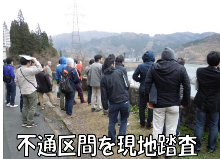
不通区間を現地踏査

14日、熊本で大地震が発生。 15日、研修冒頭に全参加者で黙祷を捧げ犠牲者の冥福をお祈りするとともに、災害から命を守るために防災士の仲間が主体的に行動していくことを確認しました。